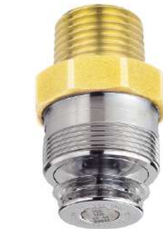
환경표지 인증기준: EL264 소방용 스프링클러헤드